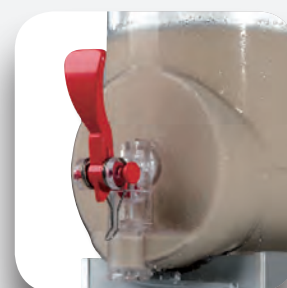
Maneta salida producto.