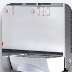
Recoge gotas extraíble.