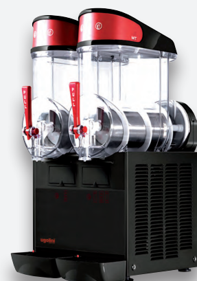
Mod. MT 2B NEGRA