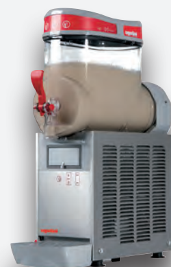
Mod. MINI 1